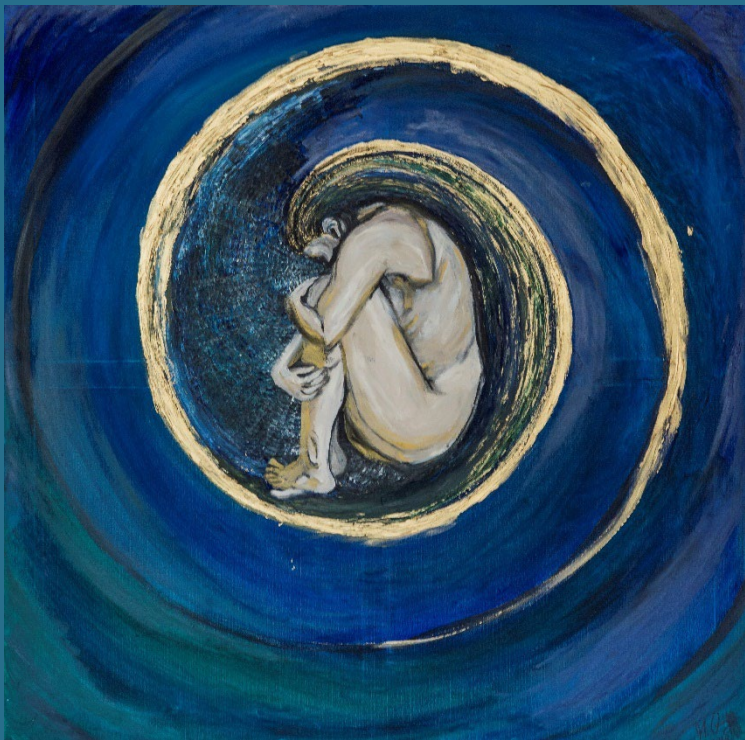
At the bottom of Fortuna's wheel